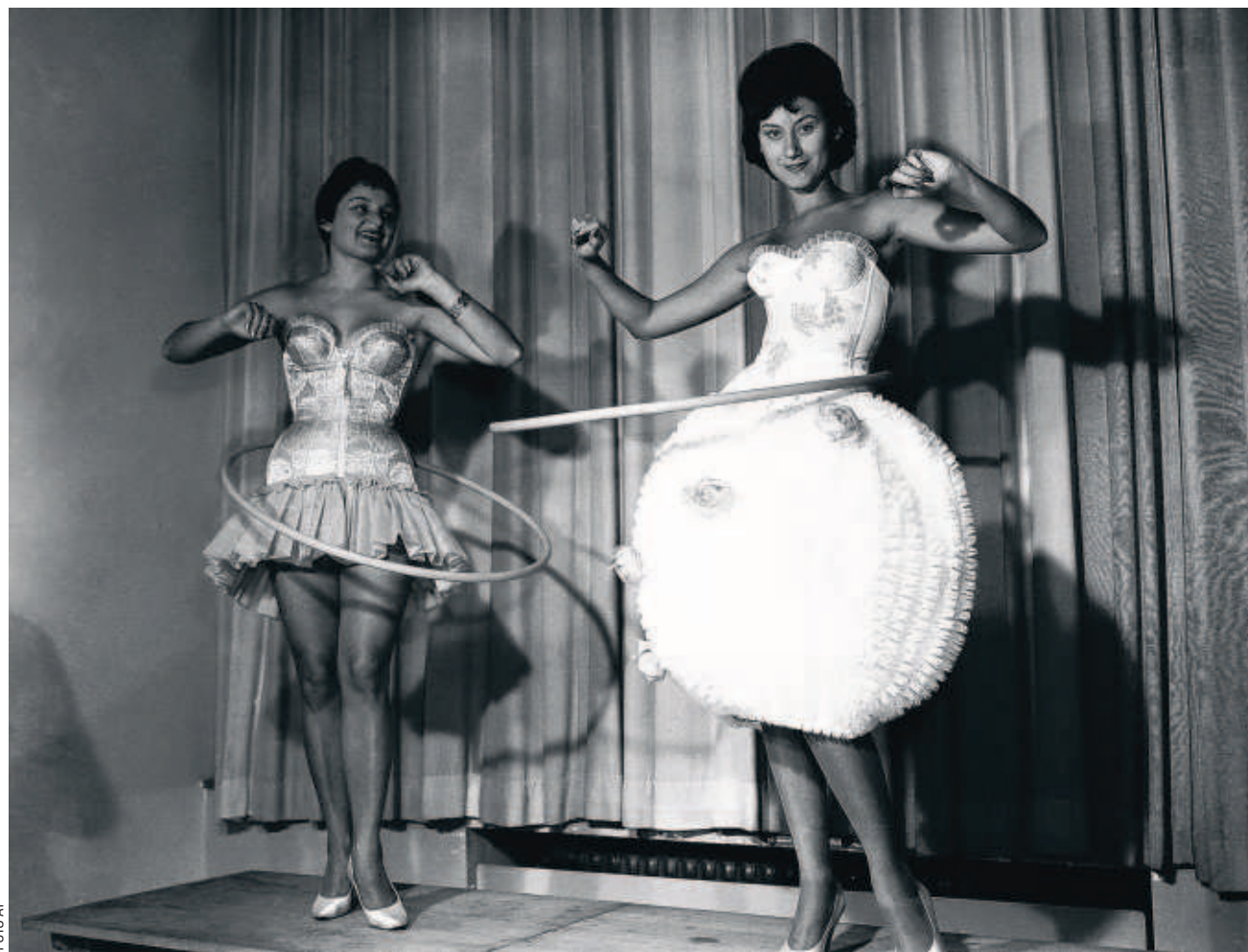
Om door een hoepel te halen: twee Duitse meisjes draaien een hoelahoep rond hun heupen in 1958.

was het begin van een successtory. In hun garage in Los Angeles produceerden ze katalpuls om valken en haviken te trainen. Wham-O was een onomatopoeie van het geluid dat de ringen maakten en het werd dan ook de naam van hun bedrijfje dat in vier maanden tijd 25 miljoen ringen verkocht. Op het hoogtepunt van hun populariteit verkochten ze 20.000 hoepels per dag. Dat eerste jaar, 1958, gingen wereldwijd 100 miljoen hoelahoeps over de toonbank. Maar Japan en Indonesië banden de hoepel en de Sovjet-Unie omschreef het spel als "het bewijs van de decadentie en de leegte van de